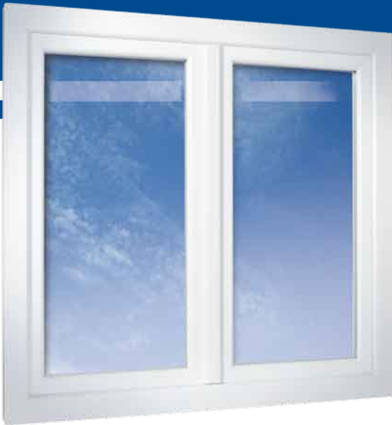
2-flügeliges Fenster in flächenversetzter Variante